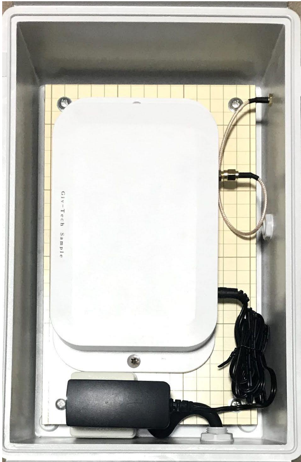
図4 AP取付状態(JZAP91A1の場合)