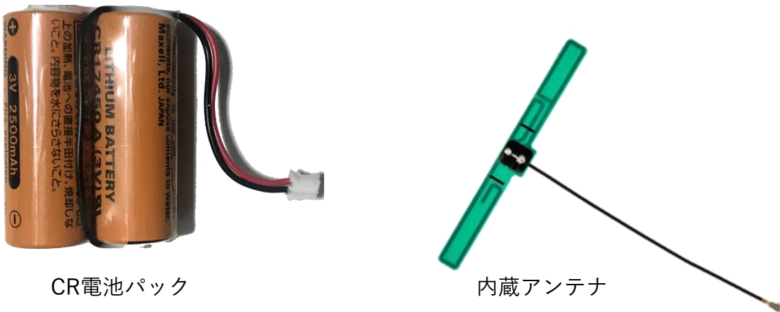
図2 付属品(バッテリーパック/RFアンテナ)